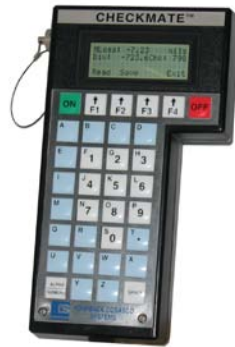
Instrumento portátil Checkmate

Para monitorear a estas sondas de hormigón, el método más sencillo es utilizar un instrumento portátil de CORROSOMETER® como Checkmate.