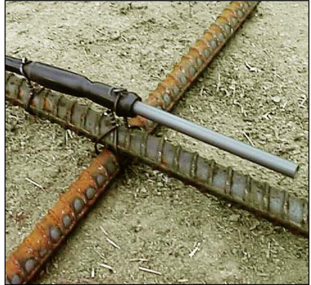
Sonda montada sobre la barra de refuerzo

Para prevenir el deterioro de una infraestructura de hormigón reforzado con hierro, se coloca una gran cantidad de estructuras nuevas con protección catódica. Las sondas CORROSOMETER® evalúan la efectividad del sistema de protección catódica, además de ofrecer un elemento de prueba que puede aislarse eléctricamente para realizar mediciones de protección catódica, como las tasas de despolarización.