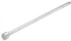
Inserto de reemplazo para el Modelo 3700