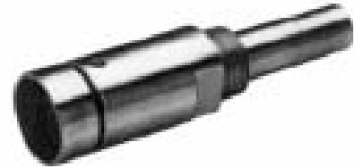
4700 - ADJ